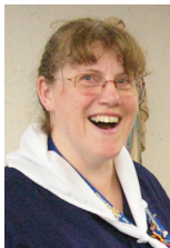
Lourdes Août Hospitalière Françoise Harvent